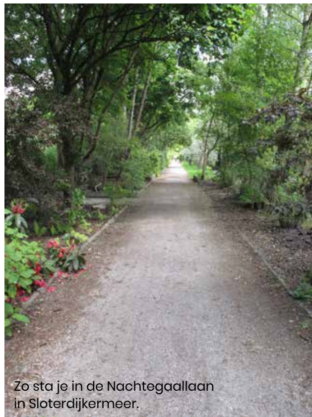
Zo sta je in de Nachtegaallaan in Sloterdijkmeer.