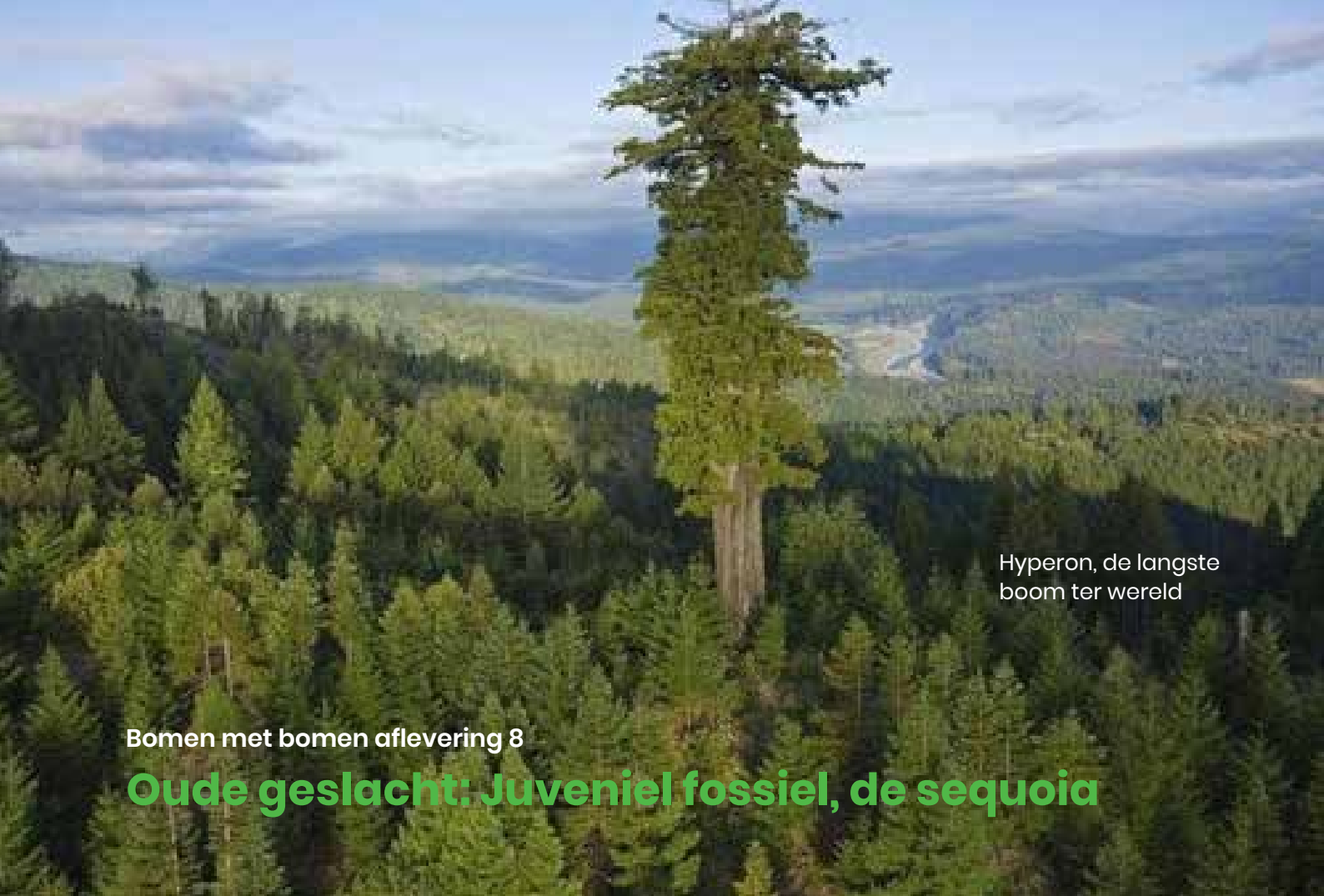
Hyperion, de langste boom ter wereld