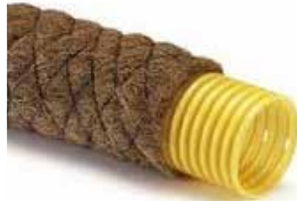
Drainagebuis met kokosvezel 090-1000, 80mm