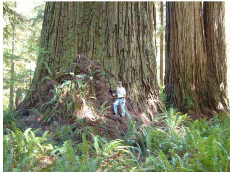
Aan de voet general Sherman, de grootste boom ter wereld

De Sequoia Sempervirens, die zich onderscheidt van de anderen doordat zij haar naalden nooit laat vallen. Die noemen zich wel de kustsequoia's. Ze hebben zich teruggetrokken in het zuiden van California. Dat geslacht kent een wereldkampioen, Hyperion, die is wereldrecordhouder 'hoogste boom ter wereld', ruim 115 meter. Denk een flat van 50 verdiepingen. Die is pas in 2007 ontdekt. Soms zie je door het bos de bomen niet meer zal ik maar zeggen.