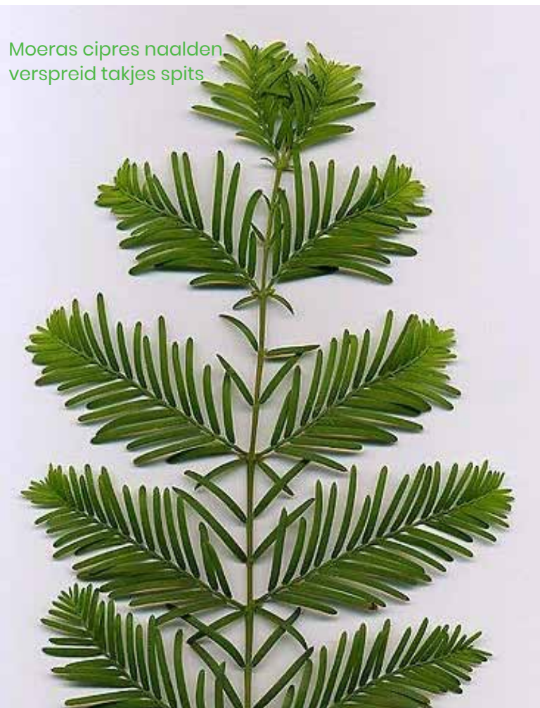
Moerascipres naalden verspreid takjes spits