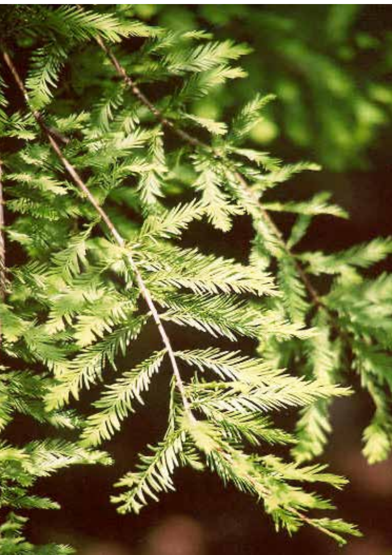
Watercipers: naalden en takjes tegenover elkaar, takjes afgerond

“Die watercipres is eenhuizig, dat wil zeggen dat mannetjes en vrouwtjes aan dezelfde boom groeien. Niet dat die bloemen zo opvallend zijn, je moet echt heel goed kijken. Ze hebben een brede zuilvormige kroon. De roodbruine bast is vezelachtig met onregelmatige ribbels. De langgesteelde, hangende kegelvormige vruchten zijn in Nederland en België in september pas rijp. Pas op twintigjarige leeftijd geven ze kiemkrachtig zaad. Duidelijk is te zien dat takjes en naalden van watercipres tegenover elkaar staan en dat de takjes afgerond eindigen. Daarmee onderscheiden ze zich van de volgende soort, de moerascipres. Daarbij is duidelijk te zien is dat takjes zowel als naalden niet tegenover elkaar maar verspreid staan en dat de takjes spits toelopen