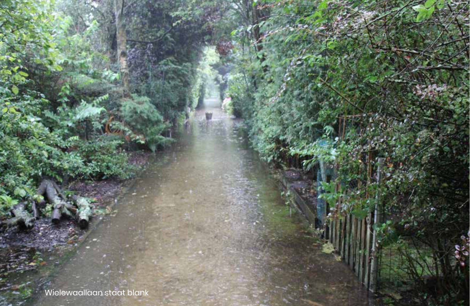
Wielewaallaan staat blank

Grondwaterstroming is ingewikkeld, omdat er veel invloeden zijn op een kleine ruimte. Enkele voorbeelden: Regenwater dat in een tuin valt, zakt wel weg. Bomen nemen in het groeiseizoen veel grondwater op. Door een “dichte bodem” van bijvoorbeeld klei en een hoog slootpeil kan grondwater slecht weg stromen. Onze veengrond kan zo uitdrogen, dat hij bijna geen water opneemt. Ook zijn er onder onze veengrond kleiplaten, waardoor er heel plaatselijk enorm veel water kan blijven staan. Door deze invloeden is het grondwatersysteem dynamisch: de grondwaterstand is van plaats tot plaats anders en het varieert in de tijd.