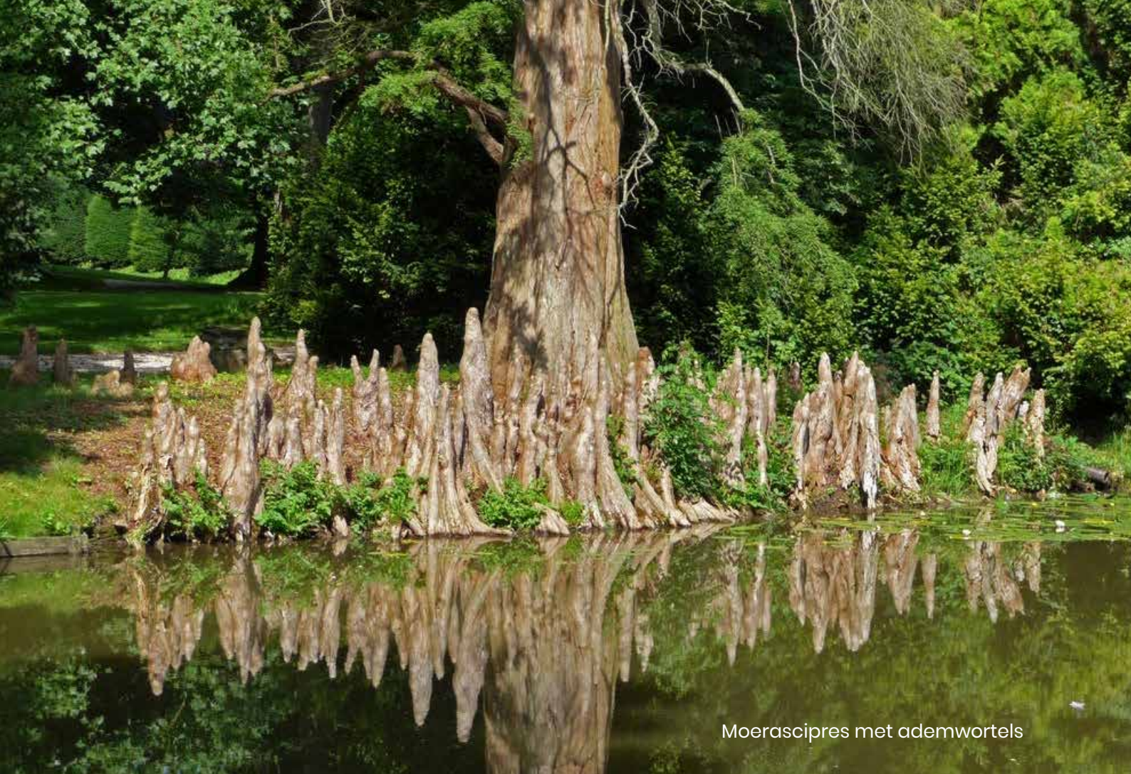
Moerascipres met ademwortels