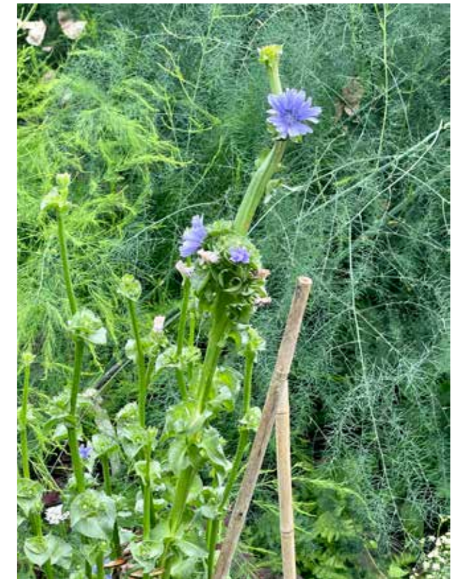
“Ik heb de andijvie laten bloeien voor het zaad, wat een prachtige bloem hé”