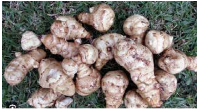
Topinamboer zijn aardperen