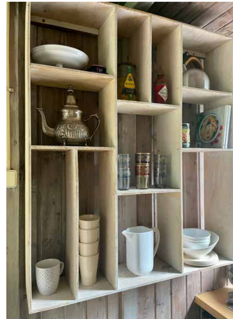
“Dit vind ik wel fotogeniek, die mix: Amsterdamse uitjes, Marokkaans theepotje, flesje Tabasco”

“Op het dak van mijn huis had ik veel planten staan, maar die werden te groot. Dus die heb ik beneden op straat gezet als een soort voortuin. Nu staan de meeste planten hier. De olijf moet nog komen, die moet ik eerst snoeien voordat hij mee kan in de auto. Ik ben nog aan het nadenken over wat ik allemaal met de tuin wil doen. In ieder geval minder gras en meer planten erin. Ik houd van blad en vooral van grote bladeren,