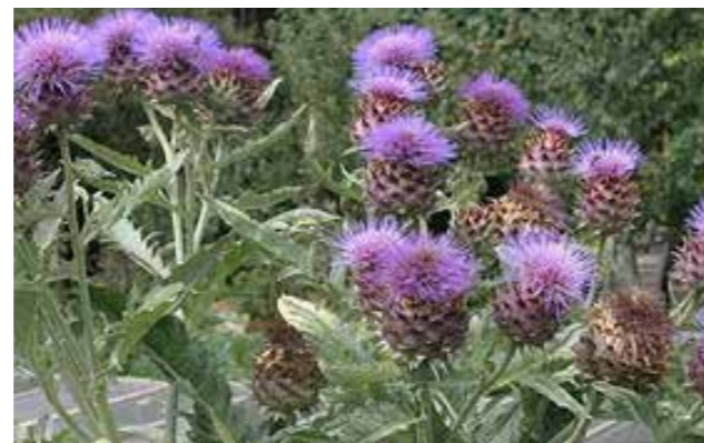
De bijen zijn ook dol op de kardoelen, die lijkt een beetje op een artisjok.

“Ik heb veel fruit en groente in de tuin: appels, peren, vijgen, moerbeï, pruimen, kweeperen. Veel wordt door dieren opgegeten, dat is ook prima. Als ik iets voor mezelf wil houden dan doe ik er zo'n netzakje omheen dat ze bij de supermarkt verkopen als je geen plastic wilt. Werkt heel goed. Ik gooi ook wel eens een klamboe over een boom. Vooral als die parkieten komen, die gooien vooral alles op de grond en vaak nog halfrijp. Dat vind ik zonde. Er staan ook allemaal verschillende soorten bessen, zoals deze appelbes bijvoorbeeld, daar houden de bijen ook van. Ik heb veel zuilfruitbomen, die nemen weinig plaats in, dan kun je veel verschillende soorten naast elkaar hebben. Kijk dit is een kikkererwt, prachtig plantje. Dat gaat natuurlijk niet zo veel oogst opleveren, misschien één bakje humus met de kerst, maar toch. Alles wat ik snoei of dorre bladeren die ik weghaal houd ik op de tuin. Dat is goed voor de tuin en goed voor allerlei insecten. Dit jaar zijn er echt wel heel weinig insecten, ik vind het echt onrustbarend.” ●