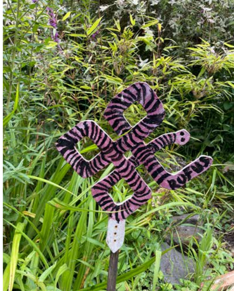
Dit bordje heeft mijn zoon op de schooltuin gemaakt. Het is een regenworm