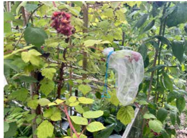
“Japanse wijnbes met beschermend zakje”