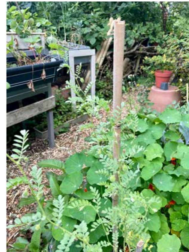
Op de voorgrond de kikkererwt