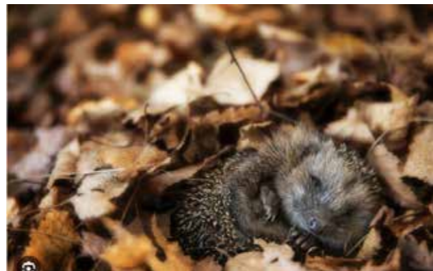
Egeltje in winterslaap

Het meest bijzonder was misschien nog wel de incidentele egel die we opvingen omdat hij ziek was of te mager om de winter in te gaan. Die werd dan tijdelijk vetgemest met kattenvoer (maden probeerden we eerst, maar die ontsnapten uit het voederbakje en verschansten zich tussen de stekels). We namen ze op schoot en aaiden ze (ze leggen hun stekels dan plat). Eén egeltje wilde nota bene zijn winterslaap beginnen in het achterwiel van mijn moeders fiets, hoog tussen de spaken en de fietstassen (en negeerde de krantenbak die voor dat doel klaar stond). Mijn moeder heeft haar fiets toen een