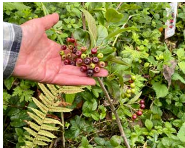
“Dit is een appelbes”