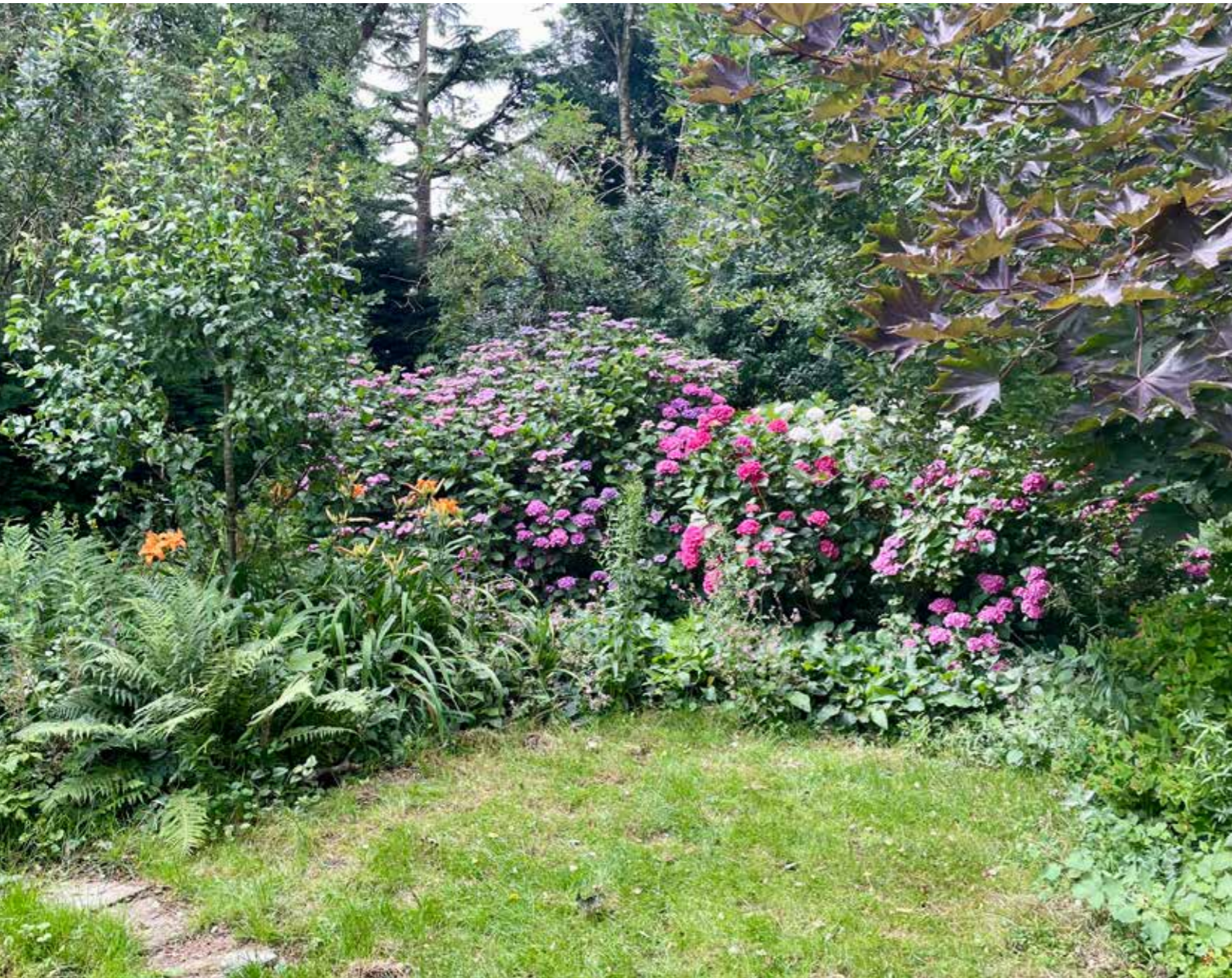
“Wat mij betreft komt er wel minder gras en meer planten”

of dieren gaan vind ik altijd interessant. Ook heb ik even gekeken bij het touwvlechten van brandnetels. Ik zou wel mee willen doen aan iets om de vogelstand op het park nog uit te breiden. Het valt me bijvoorbeeld op dat we helemaal geen mussen op het terrein hebben, zou toch leuk zijn. Ook ben ik geïnteresseerd in het uitwisselen van ervaringen met andere tuinders. Bijvoorbeeld zo’n kruidencirkel maken, ik ben benieuwd hoe anderen dat gedaan hebben. Hier staat een Japanse Indigo, dat is een plant waar blauwe kleurstof van gemaakt kan worden. Die werd vroeger gebruikt in de lakenindustrie. Het lijkt me ook leuk om ervaringen met het kweken van verplanten met andere tuinders te delen.” ●