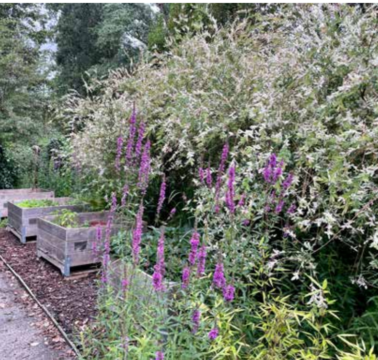
Die wilgjes vind ik heel schattig