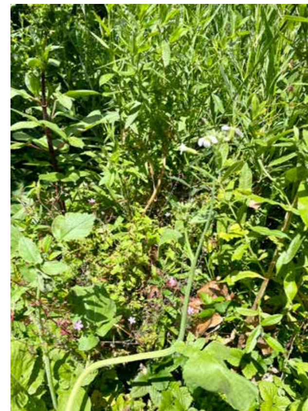
Boekweit, het witte bloemetje, vinden bijen heerlijk en is heel goed voor je grond, doordat de wortels een hardgewordene bodem kunnen doorboren en zo geschikt maken voor andere planten