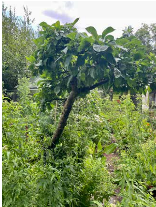
De laatste keer hing die zwerm in dat appelboompje, dat is al heel oud en is er bijna aan bezweken. Het is een heel gewicht zo'n zwerm.