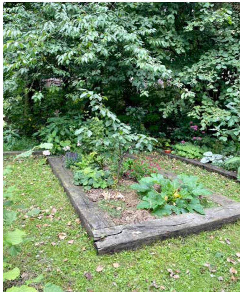
Die bielsen liggen er nog niet zo lang in

hele winter in de schuur laten staan en die egel heeft daar de hele winter gezeten.”