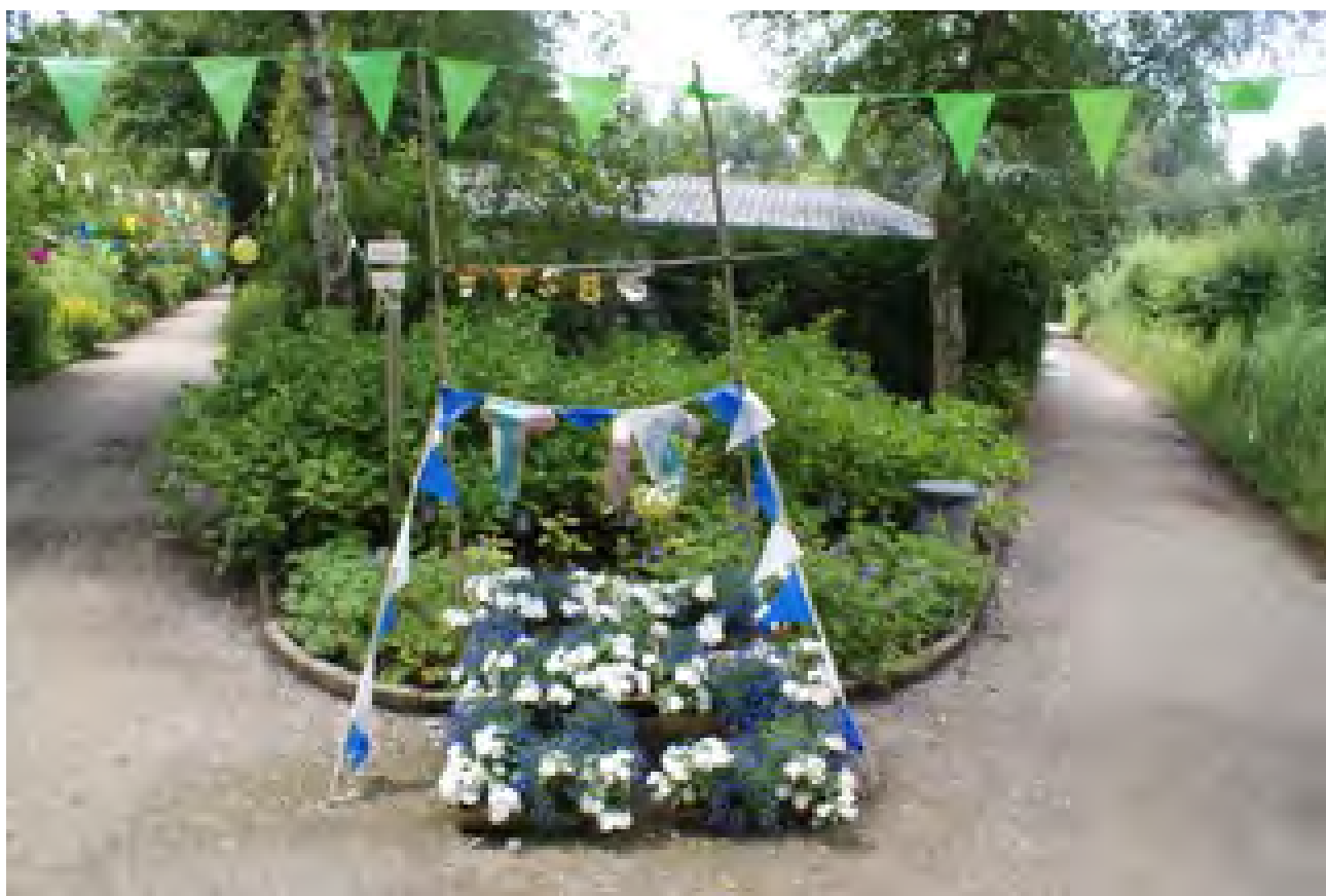
Een bloemenhulde vormt het getal 85 (gemaakt door Ben F.)