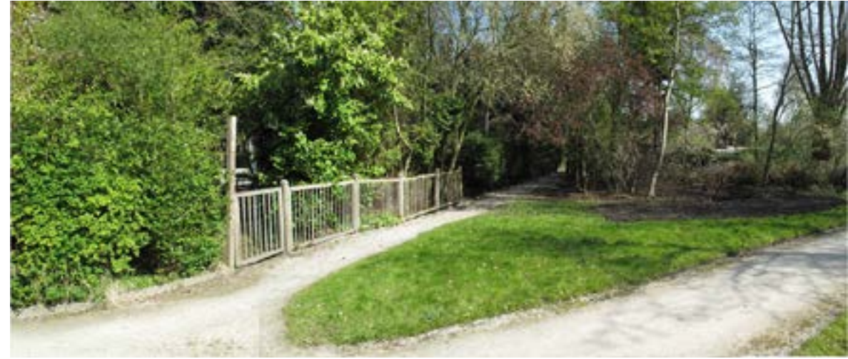
Het paddenpoellandje in april 2021