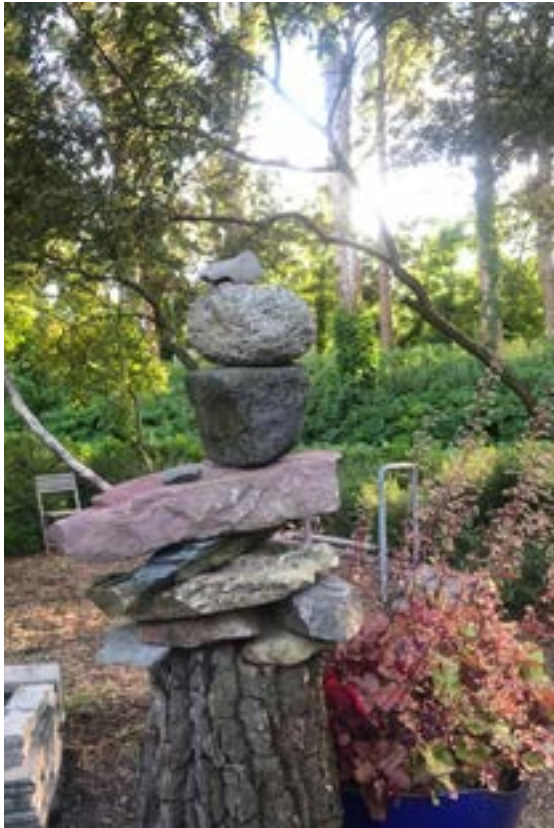
Foto-impressie van de steenstapeltuin in wording aan het Zwaluwlaantje