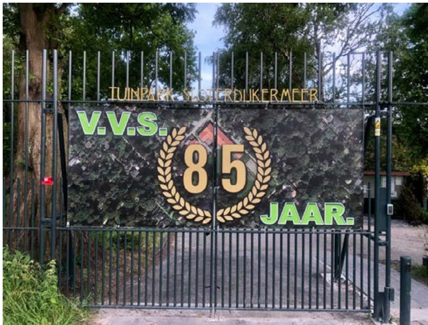
Foto van ons toegangshek met Lustrumbanier

https://watermonsters.natuurenmilieu.nl/waterkwaliteit-biodiversiteit