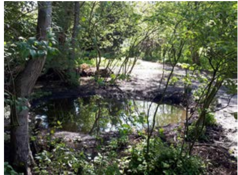
Het paddenpoellandje eind mei 2021