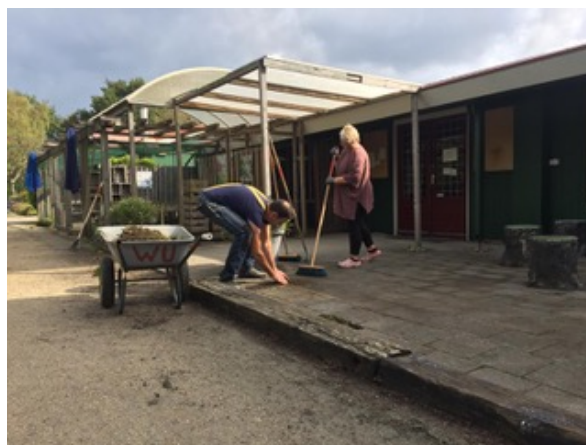
Het onkruid tussen de tegels in de buitenopslag-ruimte van de Inkoop woekert welig.