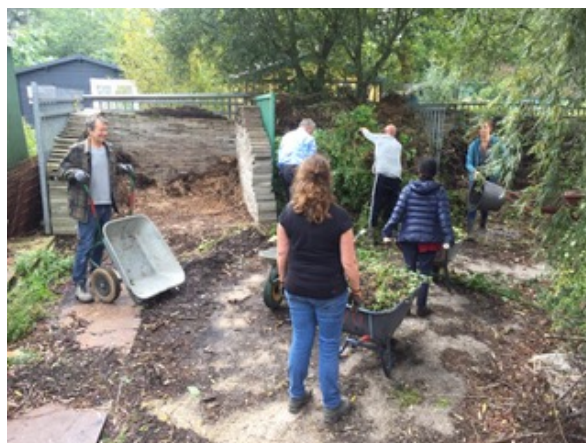
En al het snoeiafval en onkruid wordt naar de ruimte achter de werf van de Inkoop gebracht.