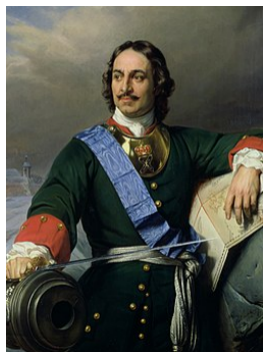
Tsaar peter de Grote

Zelfs een Russische tsaar bracht hier vier maanden door om het timmermansvak te leren en het is dan ook niet toevallig dat in St. Petersburg, de nieuwe residentie (in 1703) van de Russische tsaar veel huizen werden ontworpen waarvan het oorspronke-