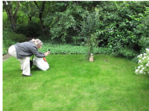
Iris fotografeert een kunstobject voor ons themanummer