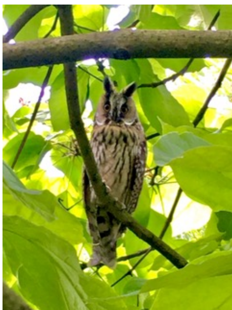
Ransuil in de Spreeuwenlaan.

Inmiddels is er wel een actief Instagram-account: @detuinenvanwesterpark, waarin veel informatie is te vinden over onze tuinparken. Van de vlindertuin bij Nut en Genoegen tot de ransuilen die dit