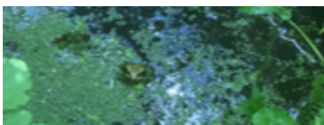
Een kikkertje steekt de kop boven water