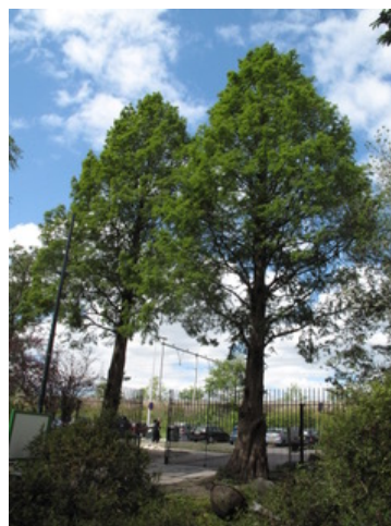
Watercypressen bij de hoofdingang