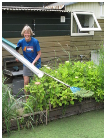
En van Wilma (Ade 14) aan de sloot

En Jaap Glas stuurde een bijdrage in de vorm van een brief aan het Bestuur en leden van de Werkgroep Waterkwaliteit.