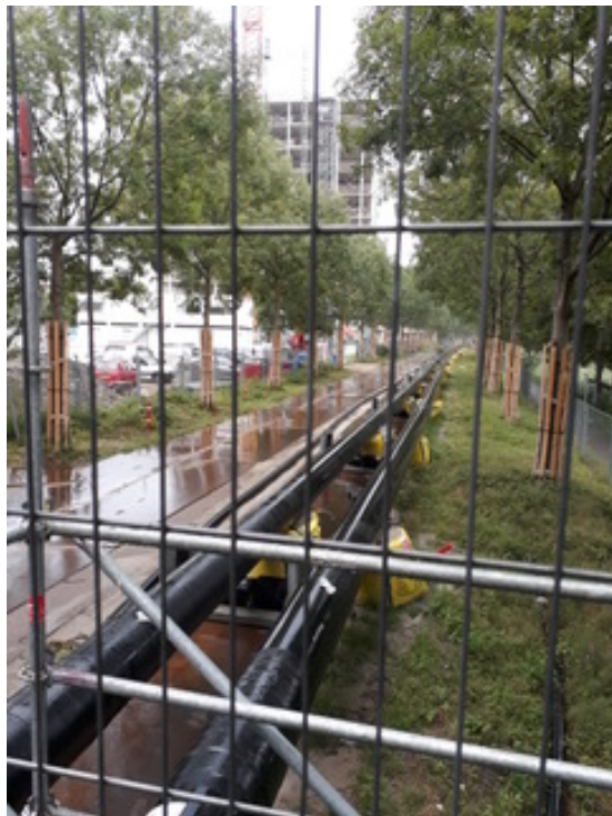
De leiding ligt klaar, wel 300 meter lang

Op het Brettenpad wordt een warmteleiding horizontaal onder het fietspad en de ringweg bij Sloterdijk geschoven. Verscheidene malen ontvingen de tuinders een bericht dat er, vooral in het weekend, wel sprake zou zijn van geluidsoverlast.