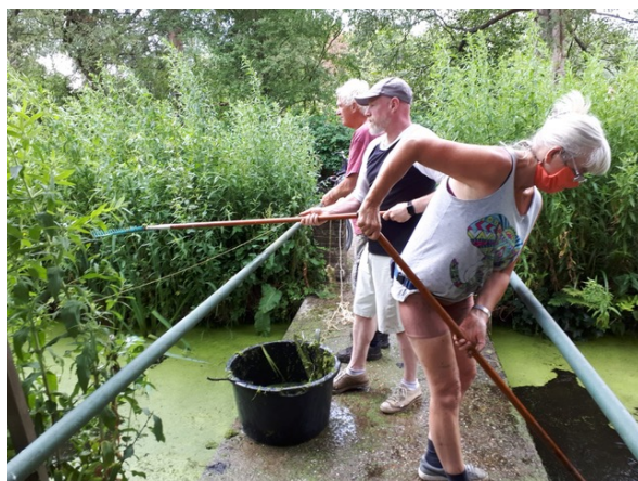
Nog een foto van de kroossharkers in de Koekoeklaan op 21 juni

Geprobeerd wordt om op zondagmiddag een wekelijks kroosurtje van de grond te krijgen. Van 16.00 tot 17.00 uur gaan we harken en de sloot bijhouden met daarna een borrel. Kijk hiervoor ook naar de Bestuursmededelingen in dit nummer, bij het onderwerp KROOSHARKEN.