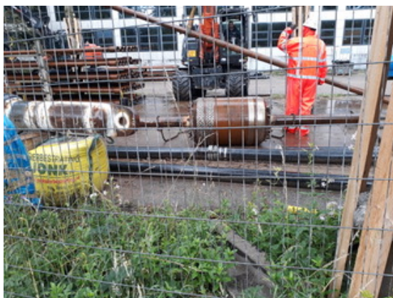
De boorkop waar de leiding achteraan wordt geduwd