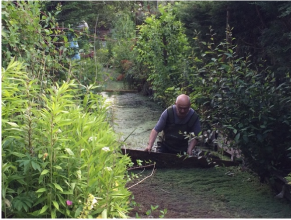
In de driehoek Vroegop/Zwaluw/Fazant is hard gewerkt. Met een balk werd het kroosvaren naar de brug geschoven en daar geschept