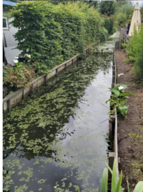
Klaas in de Vinkenlaan kreeg gezelschap van waterhoentjes