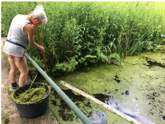
Marjan (Koe47) stuurde een rapportage over de gezamenlijke kroossharkactie van Koekoek- en Kievitlaan (ook de foto rechtsboven)