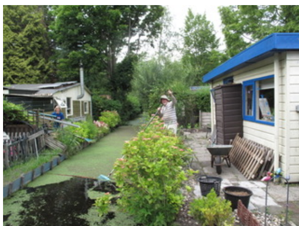
Wilma (Ade14) en Ton(Wie5) maakten de sloot kroosvrij tussen hun tuinen