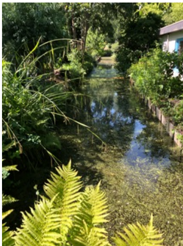
Fokko (Mee19) laat drie fases zien: dik kroosvaren, vooral eendenkroos en nagenoeg schoon