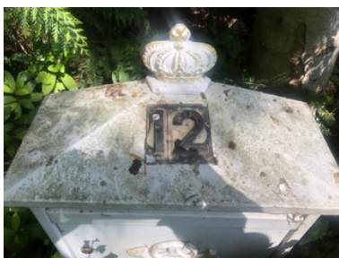
Iris fotografeert nog een brievenbus

- Het bestuur kan tuinders of bezoekers wegsturen en de toegang tot het tuinpark ontzeggen als die zich niet aan de voorschriften houden, ook als dit op de 'eigen' tuin gebeurt.