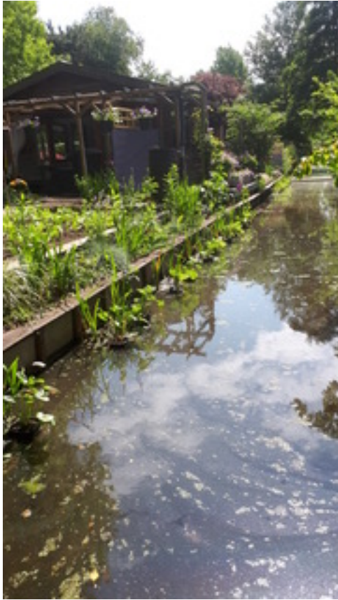
Ben en Tonny (Lee1) weten precies wat de bedoeling is