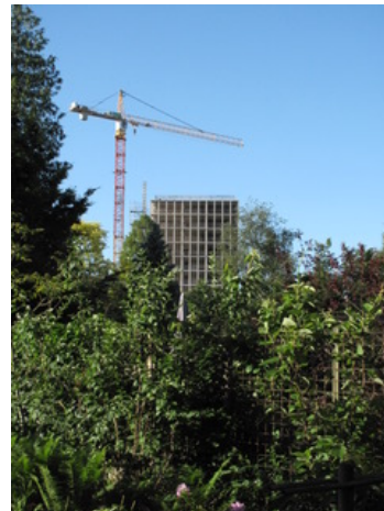
Het gestripte Postbankgebouw vanuit de Koekoeklaan

Deze mail is ook bedoeld om u kennis te laten maken met de bouwers. Het hele project op het terrein van de voormalige ING-bank bestaat uit 5 onderdelen, waarvan nu de eerste 3 onderdelen in aanbouw zijn. Aan de toren, voor het project De Voortuinen, wordt al een tijdje gewerkt door aannemer Kondor Wessels Amsterdam. En nu is ook begonnen met de sloop van de twee gebouwen daarnaast. Hier zal aannemer J.P. van Eesteren twee onderdelen bouwen: Blend, en de combinatie Pepper & Salt. Met een vraag of klacht kunt u direct bij de bouwers terecht.