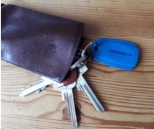
De tag hangt inmiddels aan een sleutelbos