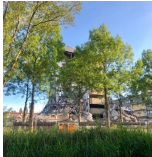
Slopen kantoorpanden aan het Brettenpad

Er is een speciale website over de bouwfase opgezet. Die biedt ook de mogelijkheid om in te schrijven voor de bouw-nieuwsbrief. Op die manier kunnen we u optimaal op de hoogte houden van alle bouwactiviteiten. De betrokken aannemers zullen regelmatig nieuwsberichten plaatsen over de voortgang, over bijzondere momenten tijdens de bouwperiode, en over te verwachten werkzaamheden en de eventuele overlast die daarbij wordt verwacht. Ook biedt de site de mogelijkheid om een vraag of klacht achter te laten.